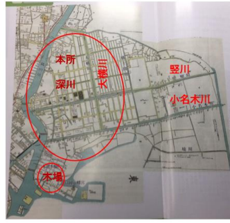
改選江戸大江図（元禄15年、1702年）

江東の本格的な発展は、明暦の大火（1657年（明暦3））後の本所・深川の開発に始まる。江戸市内からを火事から守るため、延焼防止の観点から市内の密度を下げ、市域の拡大を図った。その一環として本所・深川の開発が行われ、多くの大名屋敷や寺院が本所・深川へと移転した。