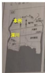
近世 江戸時代後期