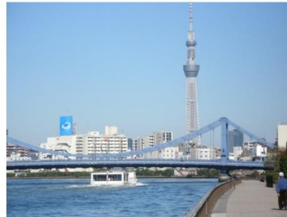
清洲橋+スカイツリー