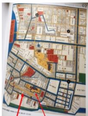
門前仲町 富岡八幡宮