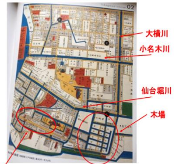
本所深川絵図（文久2年；1862年）

「木場」の条件には、市内に近いこと、水運に適していること、火事の心配がないことなどがある。適地として深川方面が挙がり、最初は佐賀・永代・福住あたりの永代島に作られた。その後、「木場」の拡大の伴い、再び移転となり、1701年（元禄14）に木場に落ち着き、その際多くの貯木場や水路が開削された。