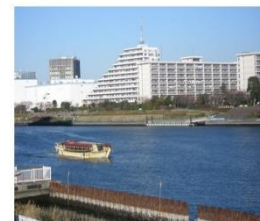
東京医科歯科大越中島宿舍