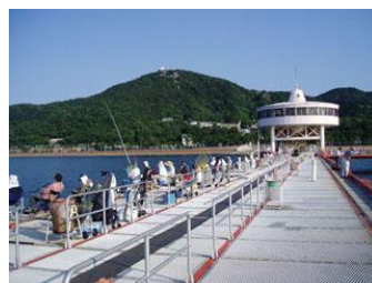
磨海づり公園 HP より