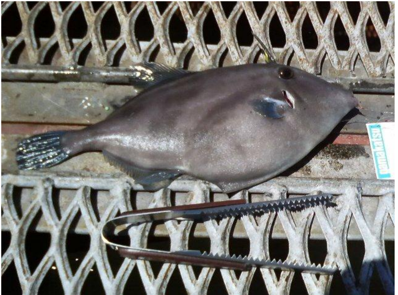
2010/7/17 14:00 頃、粘ったかきがあって、サビキに35cmのウマヅラハギがかかりました。 煮付けが最高においしかったです。