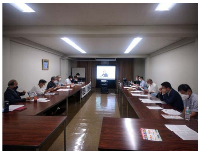
[ハイブリット会議の様子]