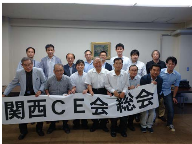
[会場参加者の集合写真]

今後も、若手・中堅・先輩諸氏と一緒に、幹事一同、関西 CE 会を盛り上げていきますので、関係者の皆様には、ご指導ご鞭撻の程よろしくお願い申し上げます。