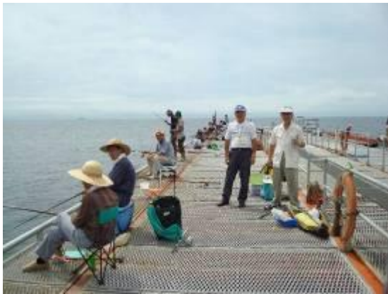
平成21年7月10日の釣行