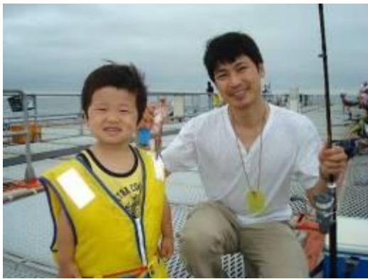
平成21年7月10日の釣行