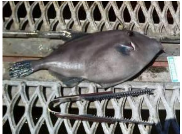
平成22年7月17日の参加は、上の2名でした。14:00頃、粘ったかいがあって、サビキに35cmのウマヅラハギがかかりました。煮付けが最高においしかったです。